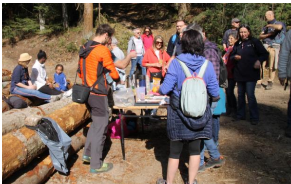
Accueil de près de 30 habitants de la région ardéchoise, jeunes et plus grands, dans notre forêt de Vocance (07), lors de la Journée Internationale des Forêts.

Les Branches locales permettent à chaque associé de s'impliquer près de chez lui : trouver une parcelle à acquérir, participer à une sortie en forêt, organiser un atelier de sensibilisation.