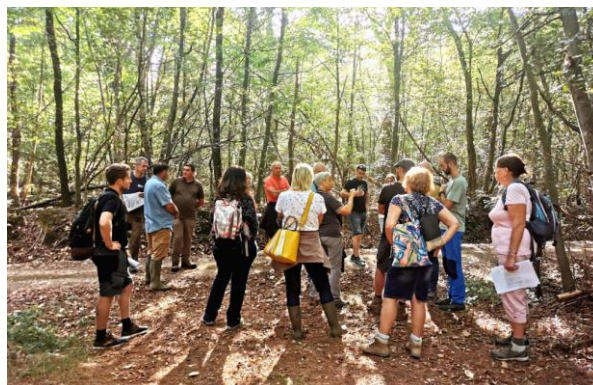
Journée de formation Fogefor, CNPF (01)

En s'appuyant sur l'expérience des premières années de CERF VERT, il a été décidé de fusionner les pôles Gestion forestière et Débouchés. En effet, la vente de bois se fait de manière simultanée avec les choix sylvicoles et le martelage. Les compétences, les outils et les processus employés sont imbriqués les uns aux autres. Il fait sens de regrouper ces deux pôles en un seul.