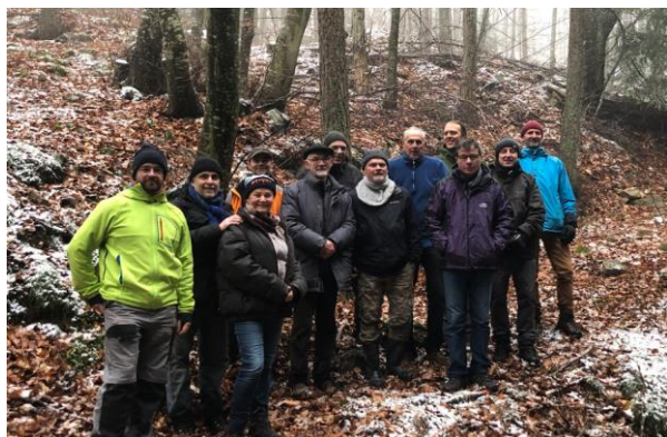
Visite forêt de Pailharès (07), janvier 2022

Ces nouvelles acquisitions réalisées en 2022 permettent à CERF VERT d'étendre sa présence régionale au sein d'Auvergne-Rhône-Alpes. CERF VERT rejoint 2 parcs naturels régionaux (le PNR des Bauges et le PNR du Livradois-Forez). C'est une excellente opportunité afin de tisser des liens avec les partenaires locaux de la filière forêt-bois.