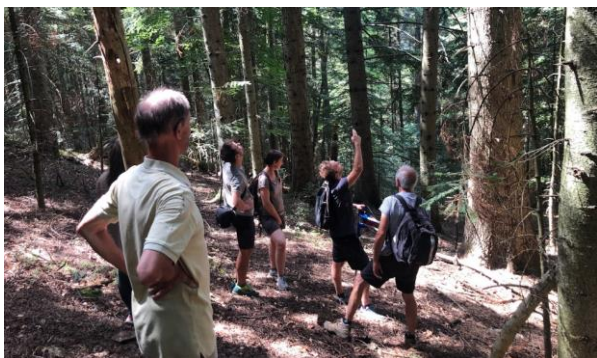
Sortie visite de forêt en Ardèche (07), août 2022.

Les Branches locales permettent à chaque associé de s'impliquer près de chez lui : trouver une parcelle à acquérir, participer à une sortie en forêt, organiser un atelier de sensibilisation.