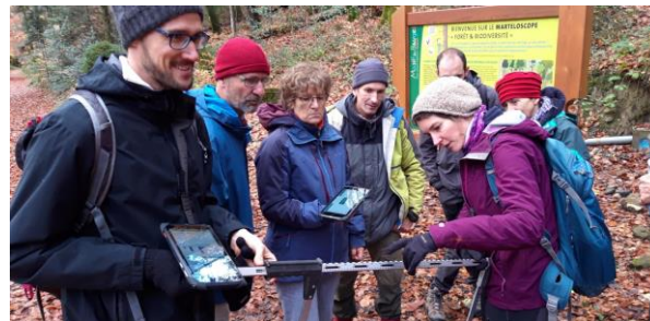
Journée marteloscope en Haute-Savoie (74) dans le parc du massif des Bauges, novembre 2022. Objectif : apprendre à marquer une coupe de bois tout en conservant les arbres à forte capacité d'accueil pour la biodiversité.

En 2022, les activités de CERF VERT ont permis de rassembler près de 200 personnes. Autant de curieux qui ont (re)découvert la forêt, ses enjeux, partagé un instant convivial.