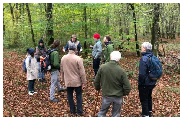
Sortie visite de forêt en Haute-Marne (52), dans le magnifique Parc national de forêts, novembre 2022. Des rencontres privilégiées avec plusieurs acteurs du parc national.

En 2022, les activités de CERF VERT ont permis de rassembler près de 200 personnes. Autant de curieux qui ont (re)découvert la forêt, ses enjeux, partagé un instant convivial.